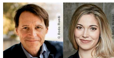
KEYNOTE SPEAKER TAG 2