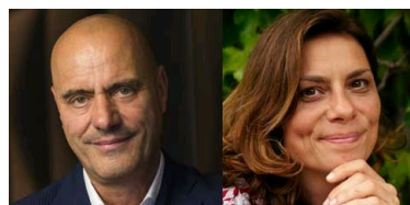
KEYNOTE SPEAKER TAG 1